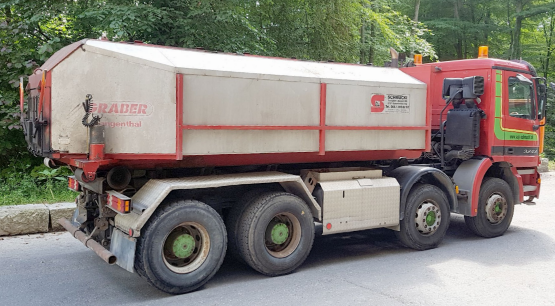
Thermo 1 Kammer 16 to. Nutzlast