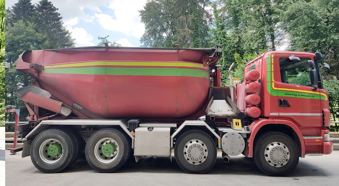
Silo ca. 19 to. Nutzlast