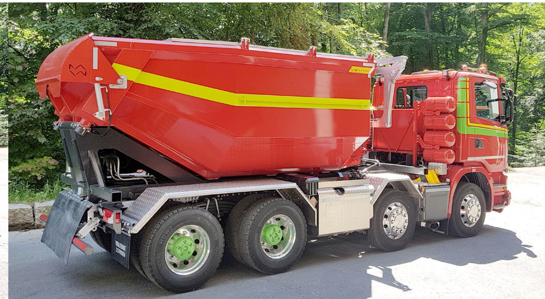
Silo ca. 19 to. Nutzlast