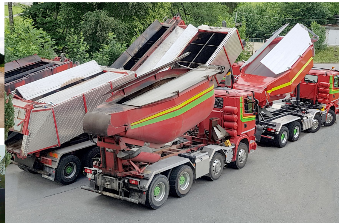
Unser erweiterter Belagsfuhrpark