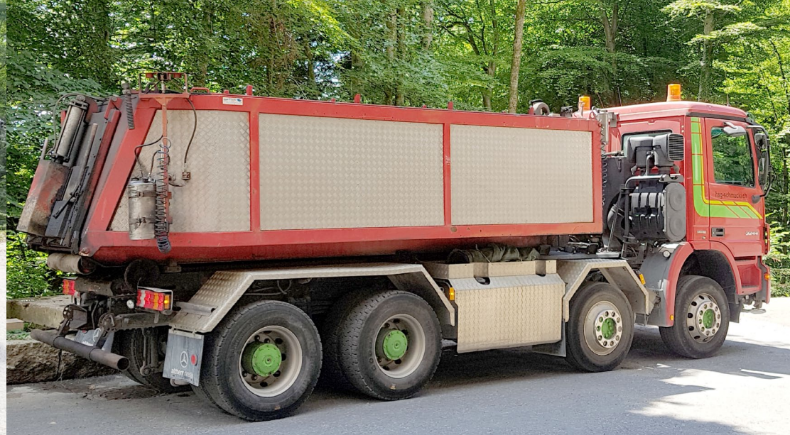
Thermo 2 Kammer 16 to. Lademenge 1/3 / 2/3