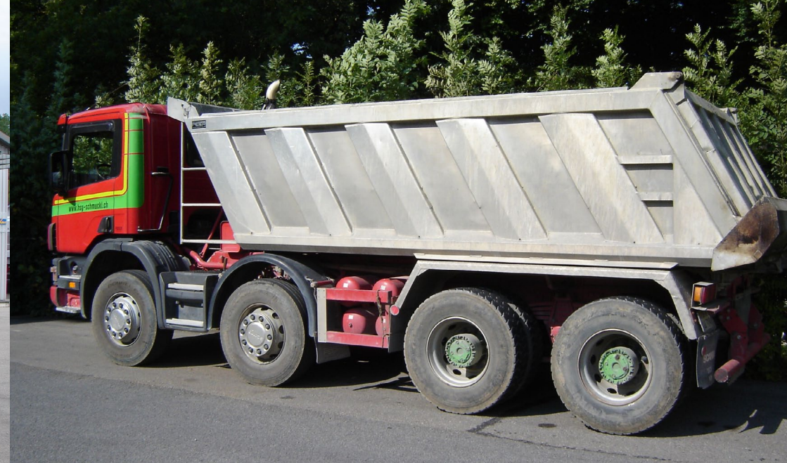
4-Achser mit Belagsdecke ca. 21 to. Nutzlast