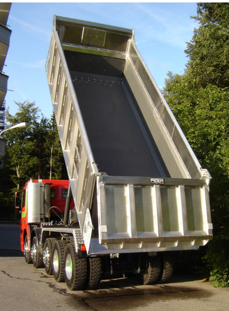
Brückenboden mit Quicksilverbeschichtung

SCHMUCKI Transport + Bagger AG 8737 Gommiswald/SG Tel. 055 285 82 52 Strassen- + Tiefbau • Abbrüche Kranarbeiten • www.hsg-schmucki.ch