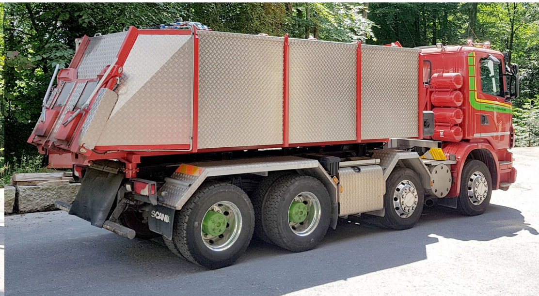
Thermo 2 Kammer 18 to. Lademenge 1/2 / 1/2