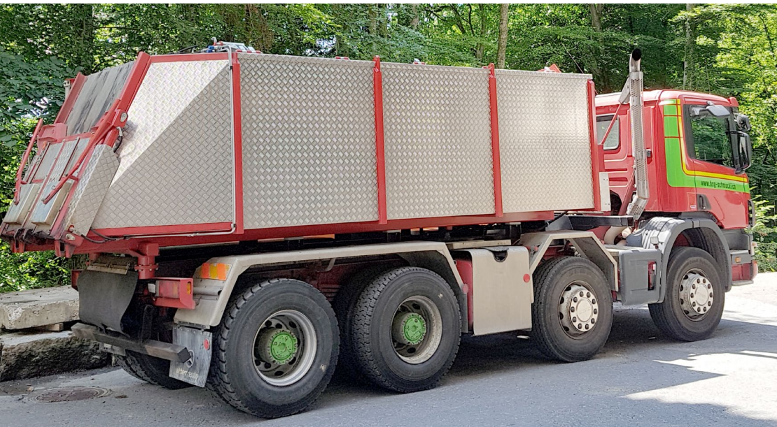
Thermo 1 Kammer 18 to. Nutzlast